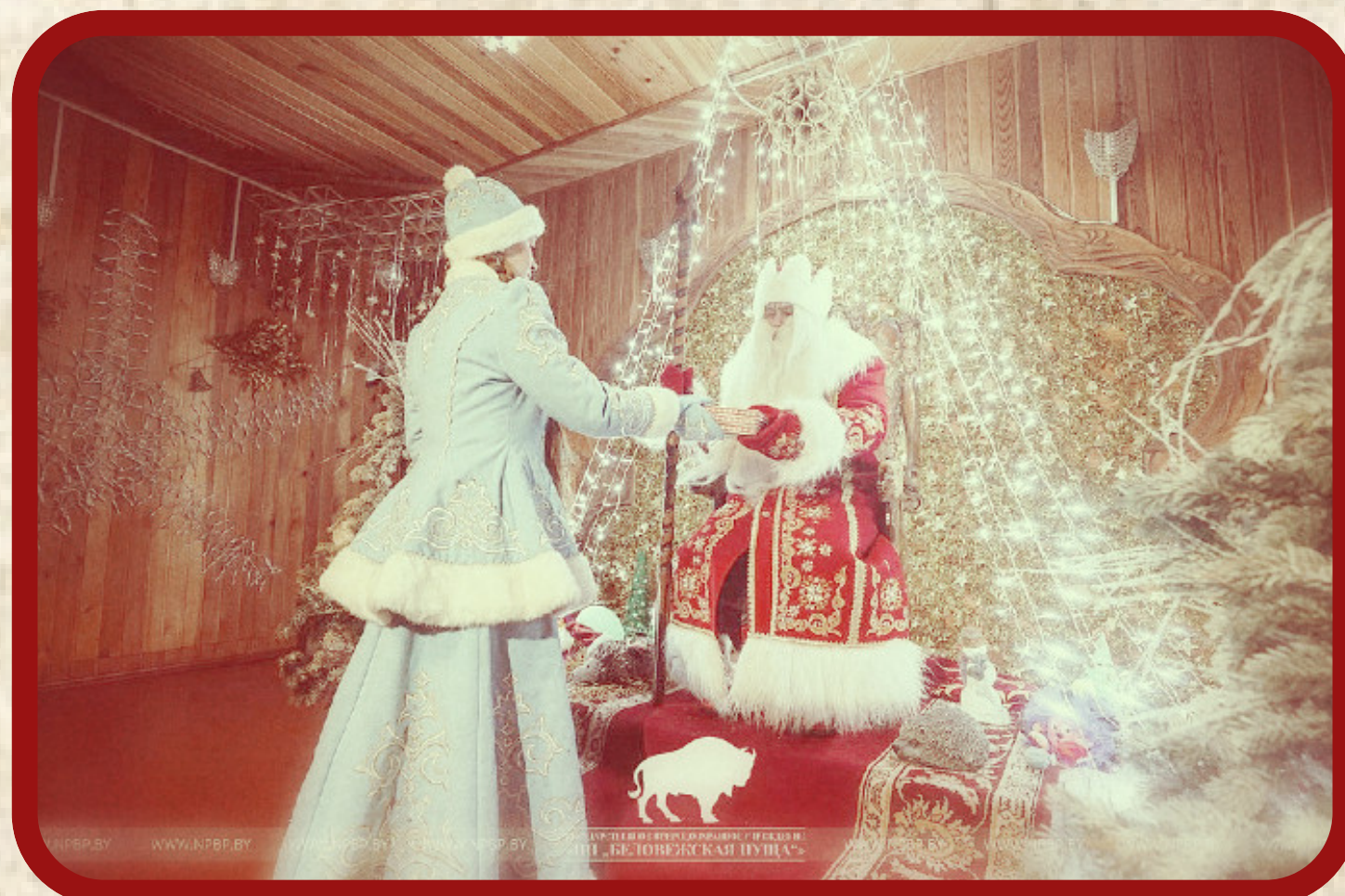
ПОМЕСТЬЕ БЕЛОРУССКОГО ДЕДА МОРОЗА

В Поместье Деда Мороза состоится Праздничное мероприятие "Беловежская сказка", приуроченное к открытию "зимнего" туристического сезона и приезду Снегурочки.